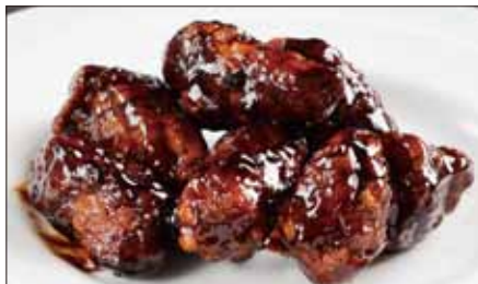
黒酢のすぶた Fried Pork with Chinese Vinegar Sauce 黒醋古老肉