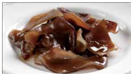
黒キクラゲの黒酢和え 600 Juda's-ear with Black Vinegar Sauce 鎮江雲耳