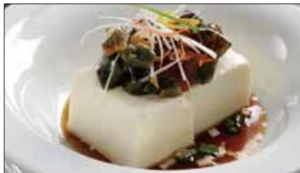
ピータン豆腐 Bean Curd and Preserved Duck's Egg with Soy Sauce 皮蛋拌豆腐

※滷水(ルーソイ): 醤油、八角、陳皮、甘草、月桂樹、草果(カルダモン)、中国冰糖、ネギ、生姜をベースに何年も継ぎ足し継ぎ足しを繰り返している当店自慢の滷水です。