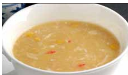
蟹肉入りコーンスープ Corn Soup with Crab Meat 蟹肉粟米湯