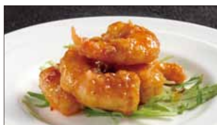
海老の マール 麻辣ソース Sauteed Peeled Shrimp with Hot Sauce 麻辣蝦仁