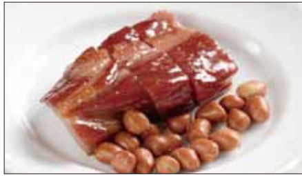
本格窯焼きチャーシュー Barbecued Pork 蜜汁叉焼