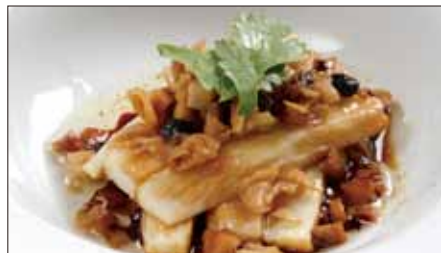
山芋の梅菜蒸し 900 Steamed Yam and Chinese Preserved Vegetable 梅菜蒸山薬