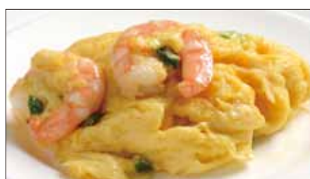
海老と玉子の炒め Sauteed Peeled Shrimp and Egg 滑蛋蝦仁