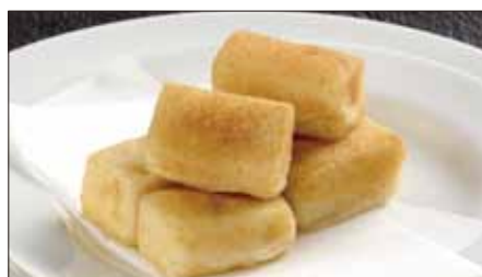
豆腐の衣揚げ 600 Deep-fried Bean Curd 金脆豆腐