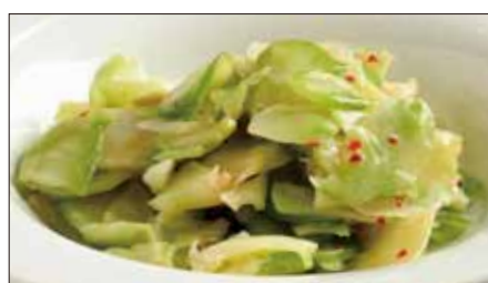
浅漬けザーサイ Pickled Sichuan Vegetables 鮮榨菜