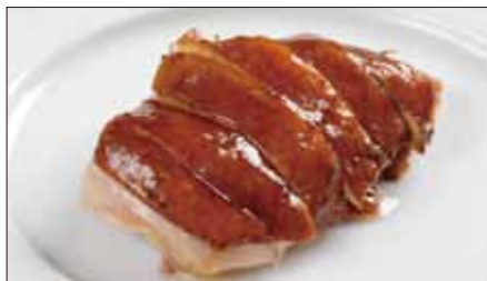
国産鶏肉の ルーソイ※ 滷水煮込み Boiled Chicken in Homemade Sauce 玫瑰油鶏