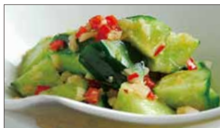
胡瓜の麻辣ニンニクソース和え Sliced Cucumber with Garlic and Hot Sauce 麻辣拌青瓜