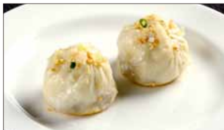
生煎包 (サンチンパオ) Pan-Fried Baozi Stuffed with Pork 生煎包

麻山椒は花椒(ホアジャオ)と呼ばれる四川省産の青山椒のことで、爽やかで鼻にぬける強い香りが特徴です。