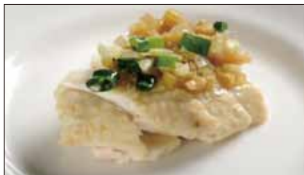
茹で国産鶏肉 ネギ・生姜ソース Boiled Chicken with Scallion and Ginger Sauce 白切肥鶏