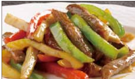
国産牛のチンジャオニューロース Sauteed Japanese Beef with Paprika 彩椒牛肉条