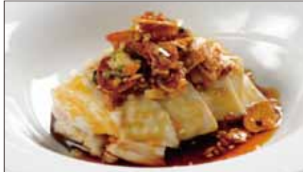
茹で国産鶏肉の唐辛子ニンニクソースがけ Boiled Chicken with Garlic and Hot Sauce 聘珍口水鶏