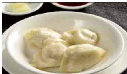
水ぎょうざ、生ニンニク添え Boiled Jiaozi Stuffed with Pork and Vegetables 水餃子