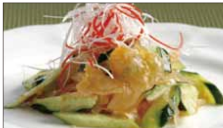
クラゲの頭と胡瓜の和え物 Sliced Jelly Fish and Cucumber with Sauce 青瓜海蜇頭