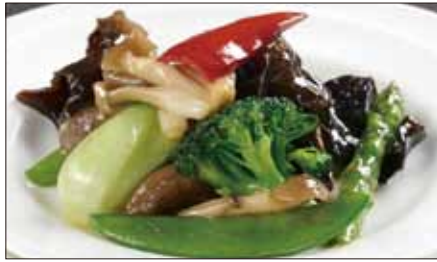
八種野菜のトリュフオイル炒め Sauteed Vegetables with Truffle Oil 松露油季節菜