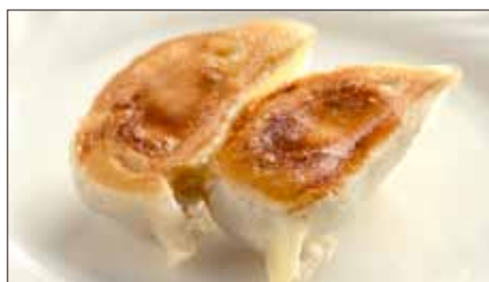
聘珍樓焼きぎょうざ Pan-Fried Jiaozi Stuffed with Pork and Vegetables 鍋貼餃