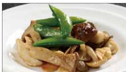
色々きのこのオリーブオイル炒め 600 Sauteed Various Mushroom with Olive Oil 橄欖油炒什菇