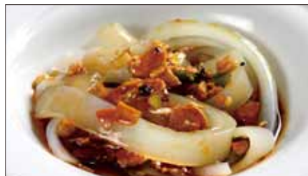
自家製春雨の麻辣ソース 800 Homemade Bean Noodles with Hot Sauce 麻辣绿豆粉