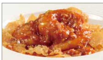
海老のチリソース Sauteed Peeled Shrimp with Chili Sauce 干焼蝦仁