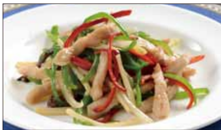
チンジャオロース (豚肉) Sauteed Pork with Sweet Pepper 青椒肉絲