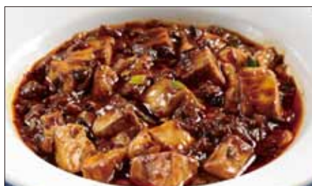
麻山椒 ※ 入りマーボー豆腐 Braised Tofu with Hot & Sichuan Pepper Sauce 聘珍麻辣豆腐