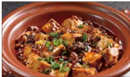
四川マーボー豆腐の土鍋煮込み Braised Tofu with Hot & Spicy Sauce 麻婆豆腐