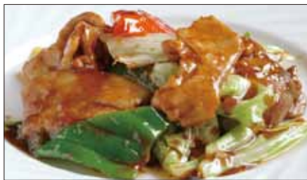
ホイコーロウ Sauteed Vegetables with Pork 回鍋肉