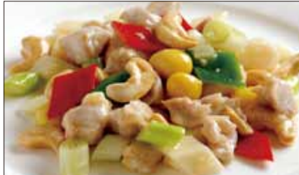
鶏肉とカシューナッツの炒め Sauteed Chicken and Cashew nut 腰果鶏丁