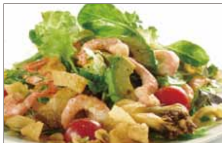
シェフサラダ Smoke Shrimp and Avocado and Mushrooms Salad 厨長沙律