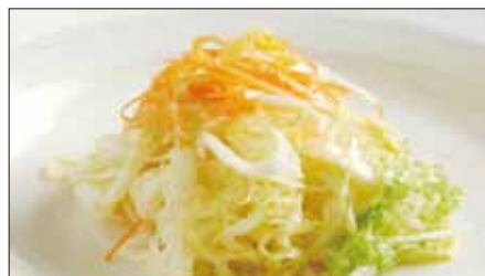
白菜の酢漬け Chinese Cabbage with Sour and Hot Sauce 酸辣白菜