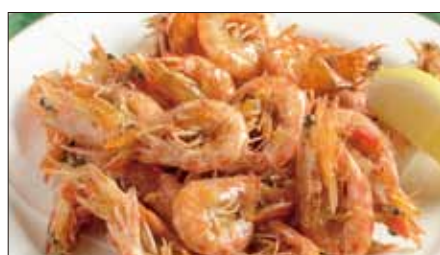
久米島産巻き海老のスパイス揚げ Fried Shrimp with Spice Salt 椒塩炸小蝦