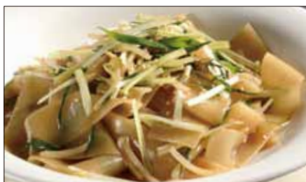
もやしと黄ニラの河粉 ※ (ホーフアン)炒め Rice Noodles with Bean Sprouts and Yellow Chive 豆芽炒河粉