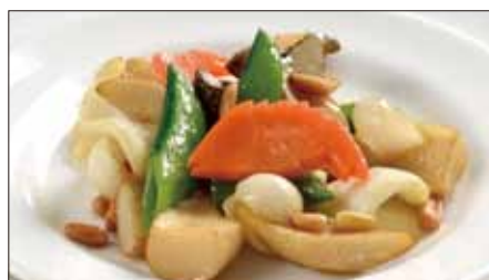
百合根とエリンギの塩炒め 800 Sauteed Lily bulb and Eryngii mushroom 百合炒杏菇