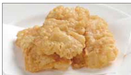
野菜入り湯葉巻きの衣揚げ 600 Deep-fried Yuba Rolls Stuffed with Vegetables 脆皮羅漢卷