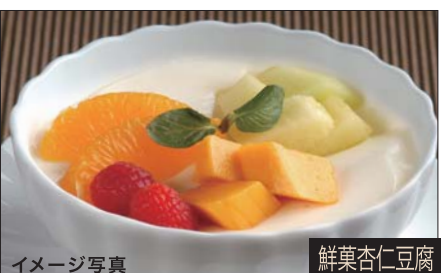
イメージ写真 鮮菓杏仁豆腐

フレッシュフルーツ入り 982 杏仁豆腐 Almond Jelly with Fruit