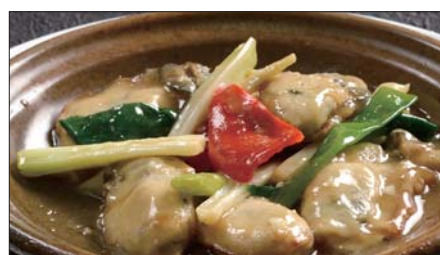
牡蠣のネギ、生姜炒め Sauteed Oyster with Green Onion and Ginger 姜葱炒蠔仔