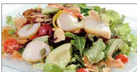
シェフサラダ (帆立貝) Smoked Scallop and Avocado and Mushrooms Salad 厨長扇貝沙律

燻製海老、ミックスベビーリーフ、ミニレタス、スプラウト、アボカド、ミニトマト、エリンギ、舞茸、パプリカ、フライドガーリック、揚げワンタン皮、ミックスナッツ (カボチャの種、アーモンドスライス、松の実)