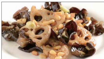
黒キクラゲ、蓮根、松の実の炒め Sauteed Judas's-ear and Lotus and pine nut 木耳炒蓮藕