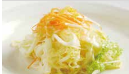
白菜の酢漬け Chinese Cabbage with Sour and Hot Sauce 酸辣白菜