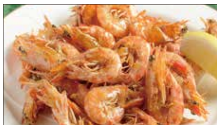
久米島産巻き海老のスパイス揚げ Fried Shrimp with Spice Salt 椒塩炸小蝦