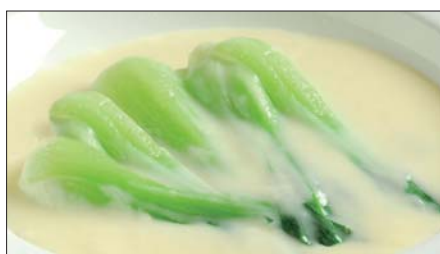
青梗菜のクリームソース Sauteed Chinese Vegetable with Cream Sauce 奶油菜胆