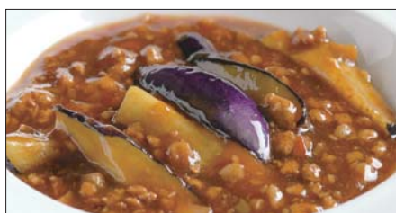
豚挽き肉と茄子の麻婆醬煮込み Stewed Eggplant with Pork Mincemeat and Hot Sauce 香辣肉崧茄瓜