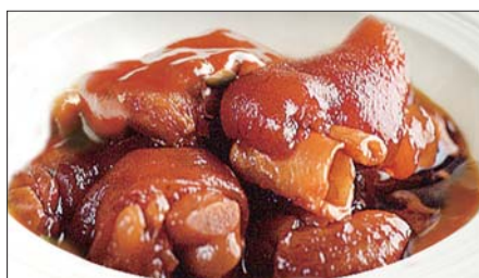
豚足、生姜の黒酢煮込み Stewed Pig Feet with Black Vinegar 浙醋姜猪爪