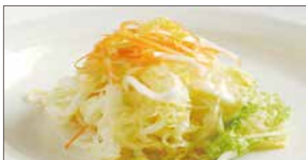
白菜の酢漬け Chinese Cabbage with Sour and Hot Sauce 酸辣白菜