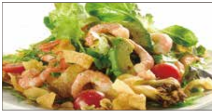
シェフサラダ(海老) Smoked Shrimp and Avocado and Mushrooms Salad 厨長蝦仁沙律