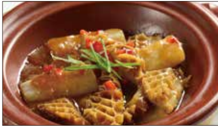
牛ハチノス、大根の沙茶醬煮込み Stewed Ox Tripe and Japanese Radish 沙茶牛肚煲 with Barbeque Sauce