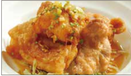
鶏もも肉のから揚げ 油淋ソース Deep-fried Chicken with Youlin Sauce 油淋炸鷄