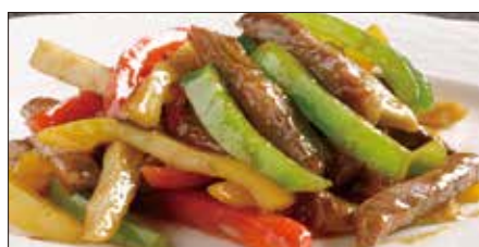
国産牛のチンジャオニューロース Sauteed Japanese Beef with Paprika 彩椒牛肉条