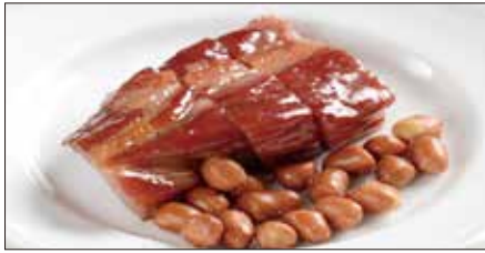
本格窯焼きチャーシュー Barbecued Pork 蜜汁叉焼