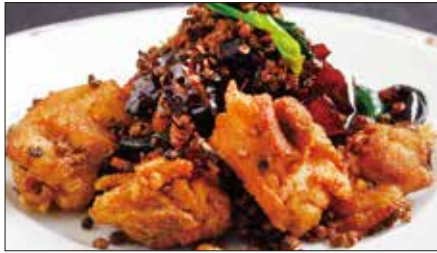
鶏肉の唐辛子山椒炒め Sauteed Chicken with Red Pepper and Pepper Tree 辣子鷄球