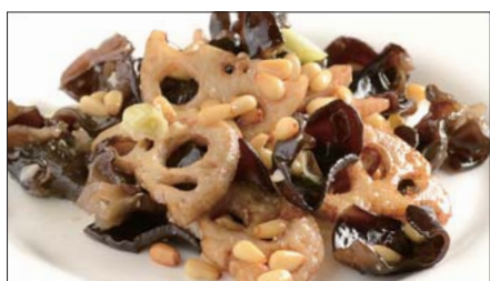
黒キクラゲ、蓮根、松の実の炒め Sauteed Judas's-ear and Lotus and pine nut 木耳炒蓮藕