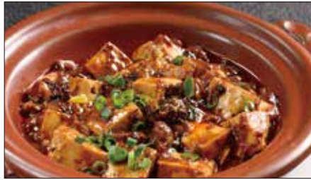
四川マーボー豆腐の土鍋煮込み Braised Tofu with Hot & Spicy Sauce 麻婆豆腐