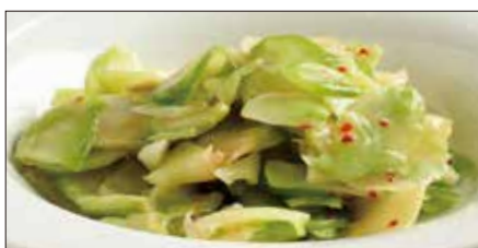
浅漬けザーサイ Pickled Sichuan Vegetables 鮮榨菜