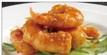
マラー 海老の麻辣ソース Sauteed Peeled Shrimp with Hot Sauce 麻辣蝦仁