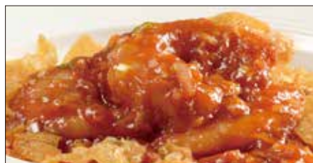
海老のチリソース Sauteed Peeled Shrimp with Chili Sauce 干焼蝦仁