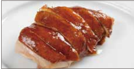
国産鶏肉の ルーソイ※ 滷水煮込み Boiled Chicken in Homemade Sauce 玫瑰油鶏