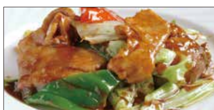
ホイコーロウ Sauteed Vegetables with Pork 回鍋肉