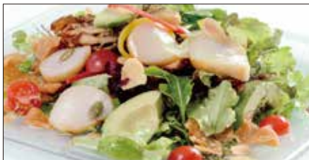
シェフサラダ(帆立貝) Smoked Scallop and Avocado and Mushrooms Salad 厨長扇貝沙律

燻製海老、ミックスベビーリーフ、ミニレタス、スプラウト、アボカド、ミニトマト、エリンギ、舞茸、パプリカ、フライドガーリック、揚げワンタン皮、ミックスナッツ(カボチャの種、アーモンドスライス、松の実)