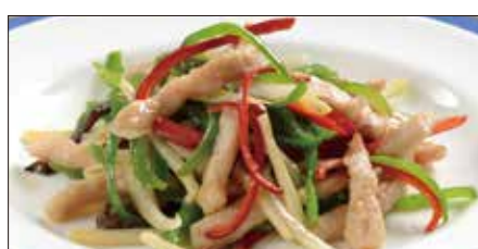
チンジャオロース (豚肉) Sauteed Pork with Sweet Pepper 青椒肉絲