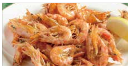
久米島産巻き海老のスパイス揚げ Fried Shrimp with Spice Salt 椒塩炸小蝦