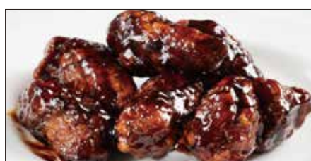
黒酢のすぶた Fried Pork with Chinese Vinegar Sauce 黒醋古老肉