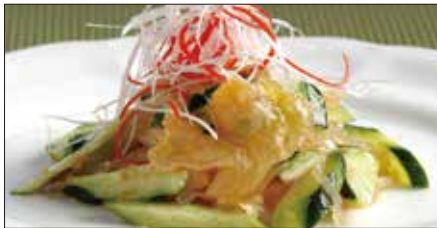
クラゲの頭と胡瓜の和え物 Sliced Jelly Fish and Cucumber with Sauce 青瓜海蜇頭

※滷水(ルーソイ): 醤油、八角、陳皮、甘草、月桂樹、草果(カルダモン)、中国冰糖、ネギ、生姜をベースに何年も継ぎ足し継ぎ足しを繰り返している当店自慢の滷水です。