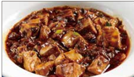
麻山椒 * 入りマーボー豆腐 Braised Tofu with Hot & Sichuan Pepper Sauce 聘珍麻辣豆腐