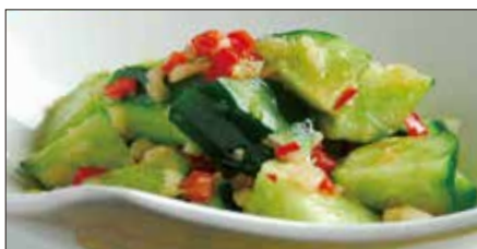
胡瓜の麻辣ニンニクソース和え Sliced Cucumber with Garlic and Hot Sauce 麻辣拌青瓜

燻製帆立貝、ミックスベビーリーフ、ミニレタス、スプラウト、アボカド、ミニトマト、エリンギ、舞茸、パプリカ、フライドガーリック、揚げワンタン皮、ミックスナッツ(カボチャの種、アーモンドスライス、松の実)