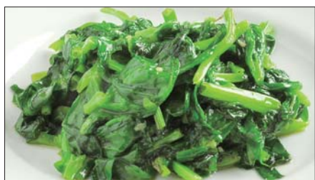
豆苗の塩味炒め Sauteed Bean Seedling 清炒豆苗