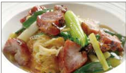
チャーシューとネギ、生姜のあんかけ焼きそば Sauteed Noodles with Barbecued Pork 姜葱叉焼炒麵