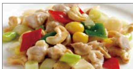
鶏肉とカシューナッツの炒め Sauteed Chicken and Cashew nut 腰果鶏丁