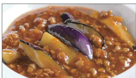
豚挽き肉と茄子の麻婆醬煮込み Stewed Eggplant with Pork Mincemeat and Hot Sauce 香辣肉崧茄瓜