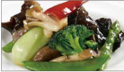
八種野菜のトリュフオイル炒め Sauteed Vegetables with Truffle Oil 松露油季節菜

Tax Included 税込 表示価格にサービス料 10%を別途頂戴いたします