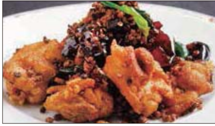
鶏肉の唐辛子山椒炒め 1,500 Sauteed Chicken with Red Pepper and Pepper Tree 辣子鷄球

Tax Included 税込 表示価格にサービス料 10%を別途頂戴いたします