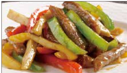
国産牛のチンジャオニューロース Sauteed Japanese Beef with Paprika 彩椒牛肉条