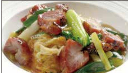
チャーシューとネギ、生姜のあんかけ焼きそば Sauteed Noodles with Barbecued Pork 姜葱叉焼炒麵