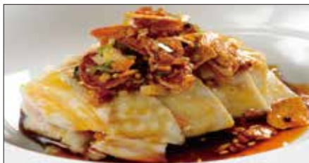
茹で国産鶏肉の唐辛子ニンニクソースがけ Boiled Chicken with Garlic and Hot Sauce 聘珍口水鶏