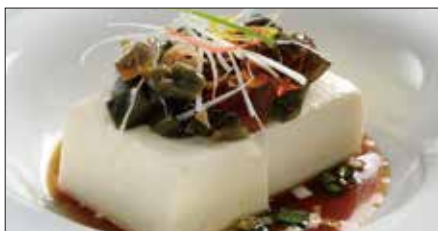
ピータン豆腐 Bean Curd and Preserved Duck's Egg with Soy Sauce 皮蛋拌豆腐

※滷水(ルーソイ): 醤油、八角、陳皮、甘草、月桂樹、草果(カルダモン)、中国冰糖、ネギ、生姜をベースに何年も継ぎ足し継ぎ足しを繰り返している当店自慢の滷水です。