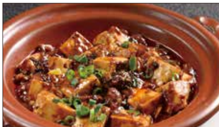
四川マーボー豆腐の土鍋煮込み Braised Tofu with Hot & Spicy Sauce 麻婆豆腐