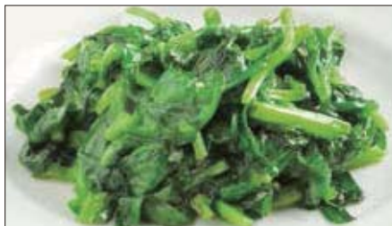
豆苗の塩味炒め Sauteed Bean Seedling 清炒豆苗