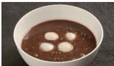
白玉団子入り陳皮香る小豆のお汁粉 1,300 Glutinous Rice Balls with Red Bean paste 紅豆沙湯圓