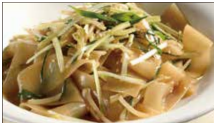
もやしと黄ニラの河粉 ※ (ホーフアン)炒め Rice Noodles with Bean Sprouts and Yellow Chive 豆芽炒河粉