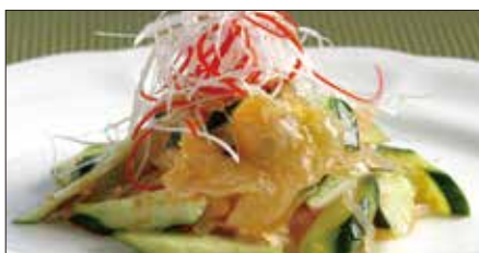
クラゲの頭と胡瓜の和え物 Sliced Jelly Fish and Cucumber with Sauce 青瓜海蜇頭