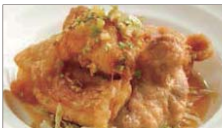
鶏もも肉のから揚げ 油淋ソース Deep-fried Chicken with Youlin Sauce 油淋炸鷄