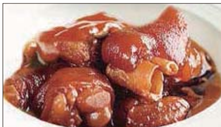
豚足、生姜の黒酢煮込み Stewed Pig Feet with Black Vinegar 浙醋姜猪爪