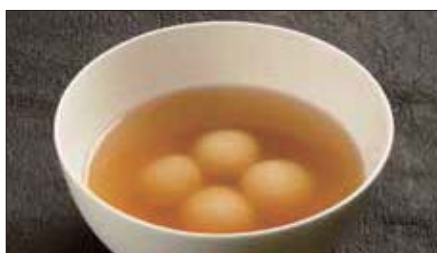
黒胡麻餡入り白玉団子 生姜の糖水 1,100 Black Sesame paste Glutinous Rice Balls with Ginger Sweet Soup 姜香流沙湯圓