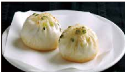
生煎包 (サンチンパオ) Pan-Fried Baozi Stuffed with Pork 生煎包