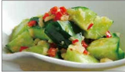
胡瓜の麻辣ニンニクソース和え Sliced Cucumber with Garlic and Hot Sauce 麻辣拌青瓜

Tax Included 税込 表示価格にサービス料 10%を別途頂戴いたします