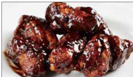
黒酢のすぶた Fried Pork with Chinese Vinegar Sauce 黒醋古老肉