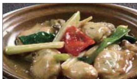
牡蠣のネギ、生姜炒め Sauteed Oyster with Green Onion and Ginger 姜葱炒蠔仔