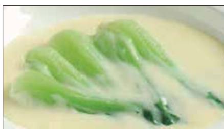
青梗菜のクリームソース Sauteed Chinese Vegetable with Cream Sauce 奶油菜胆