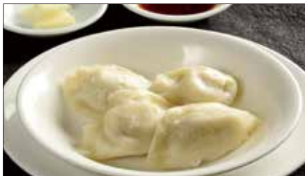
水ぎょうざ、生ニンニク添え Boiled Jiaozi Stuffed with Pork and Vegetables 水餃子