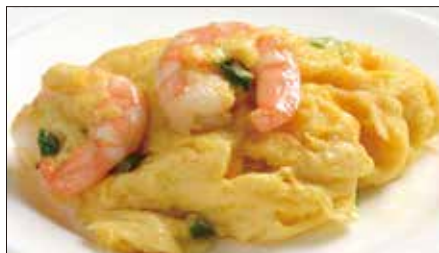
海老と玉子の炒め Sauteed Peeled Shrimp and Egg 滑蛋蝦仁