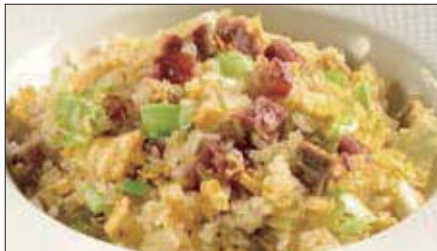
チャーシューとレタスのコンニャク米 ※ チャーハン 1,800 Stir-fried Small Konjak boll with Roasted Pork and Lettuce 叉焼炒蒟蒻米 ※コンニャク米…お米の代用品で、コンニャクを米粒大にした加工品。コンニャクは不溶性食物繊維が豊富で、腸内の濁物を体外へ排出させる作用に優れています。