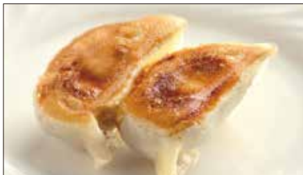
聘珍樓焼きぎょうざ Pan-Fried Jiaozi Stuffed with Pork and Vegetables 鍋貼餃