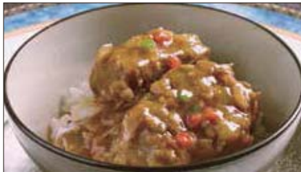
牛スネ肉のカレーあんかけご飯 1,000 Rice with Beef Curry 咖哩牛脛飯