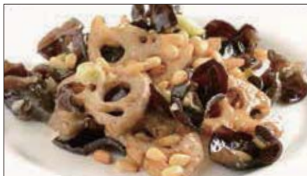
黒キクラゲ、蓮根、松の実の炒め Sauteed Judas's-ear and Lotus and pine nut 木耳炒蓮藕

Tax Included 税込 表示価格にサービス料 10%を別途頂戴いたします