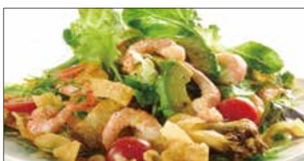
シェフサラダ (海老) Smoked Shrimp and Avocado and Mushrooms Salad 厨長蝦仁沙律