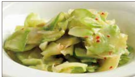
浅漬けザーサイ Pickled Sichuan Vegetables 鮮榨菜