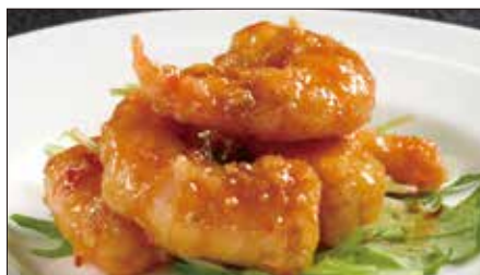
マールー 海老の麻辣ソース Sauteed Peeled Shrimp with Hot Sauce 麻辣蝦仁