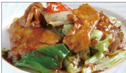
ホイコーロウ Sauteed Vegetables with Pork 回鍋肉