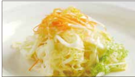
白菜の酢漬け Chinese Cabbage with Sour and Hot Sauce 酸辣白菜