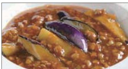
豚挽き肉と茄子の麻婆醬煮込み Stewed Eggplant with Pork Mincemeat and Hot Sauce 香辣肉崧茄瓜