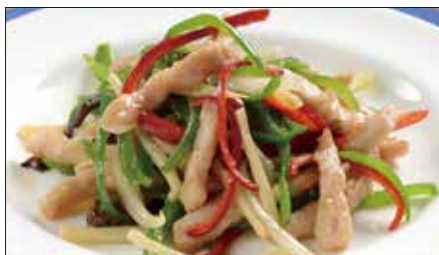
チンジャオロース (豚肉) Sauteed Pork with Sweet Pepper 青椒肉絲