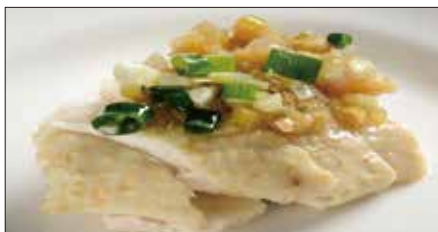
茹で国産鶏肉 ネギ・生姜ソース Boiled Chicken with Scallion and Ginger Sauce 白切肥鶏