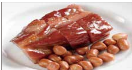
本格窯焼きチャーシュー Barbecued Pork 蜜汁叉焼

Tax Included 税込 表示価格にサービス料 10%を別途頂戴いたします