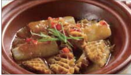
牛ハチノス、大根の沙茶醬煮込み 1,300 Stewed Ox Tripe and Japanese Radish 沙茶牛肚煲 with Barbeque Sauce