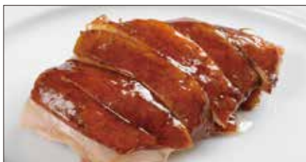
国産鶏肉の ルーソイ 滷水煮込み Boiled Chicken in Homemade Sauce 玫瑰油鶏