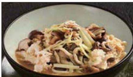
色々きのこの伊府麺、トリュフオイルの香り 1,200 Stewed Noodles with Various Mushroom, Truffle Oil 松露油什菇伊麵