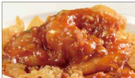
海老のチリソース Sauteed Peeled Shrimp with Chili Sauce 干焼蝦仁