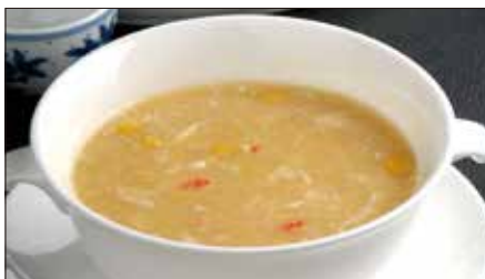
蟹肉入りコーンスープ Corn Soup with Crab Meat 蟹肉粟米湯