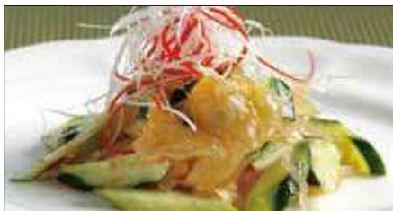
クラゲの頭と胡瓜の和え物 Sliced Jelly Fish and Cucumber with Sauce 青瓜海蜇頭