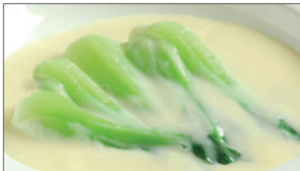
青梗菜のクリームソース Sauteed Chinese Vegetable with Cream Sauce 奶油菜胆