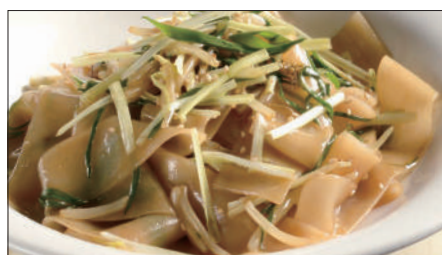
もやしと黄ニラの河粉 ※ (ホーフアン)炒め Rice Noodles with Bean Sprouts and Yellow Chive 豆芽炒河粉