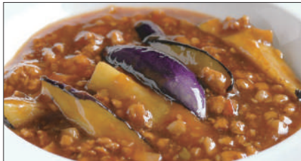
豚挽き肉と茄子の麻婆醬煮込み Stewed Eggplant with Pork Mincemeat and Hot Sauce 香辣肉崧茄瓜