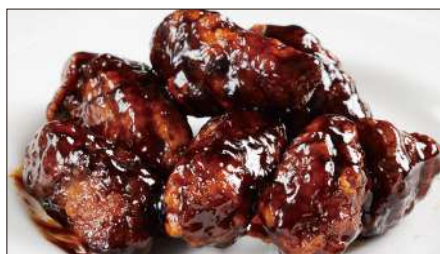
黒酢のすぶた Fried Pork with Chinese Vinegar Sauce 黒醋古老肉