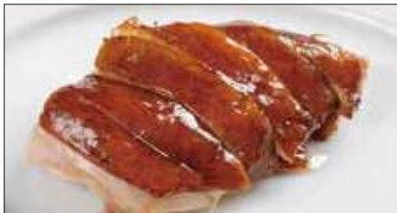
国産鶏肉の ルーソイ ※ 滷水煮込み Boiled Chicken in Homemade Sauce 玫瑰油鶏