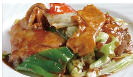
ホイコーロウ Sauteed Vegetables with Pork 回鍋肉