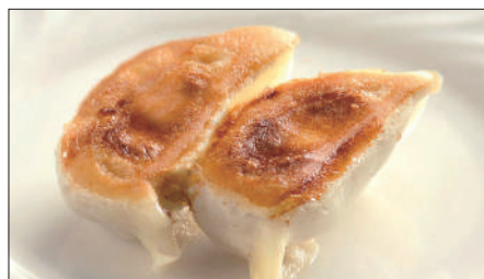
聘珍樓焼きぎょうざ Pan-Fried Jiaozi Stuffed with Pork and Vegetables 鍋貼餃