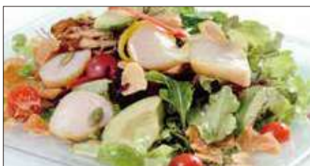
シェフサラダ (帆立貝) Smoked Scallop and Avocado and Mushrooms Salad 厨長扇貝沙律

燻製海老、ミックスベビーリーフ、ミニレタス、スプラウト、アボカド、ミニトマト、エリンギ、舞茸、パプリカ、フライドガーリック、揚げワンタン皮、ミックスナッツ (カボチャの種、アーモンドスライス、松の実)