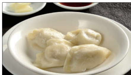
水ぎょうざ、生ニンニク添え Boiled Jiaozi Stuffed with Pork and Vegetables 水餃子