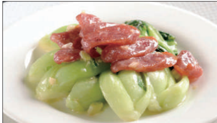
おすすめ野菜と腸詰めの炒め 1,300 Sauteed Chinese Sausage and Vegetable 腊腸炒時蔬