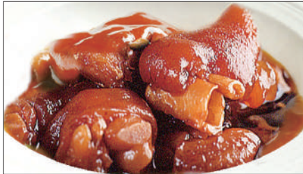
豚足、生姜の黒酢煮込み Stewed Pig Feet with Black Vinegar 浙醋姜猪爪