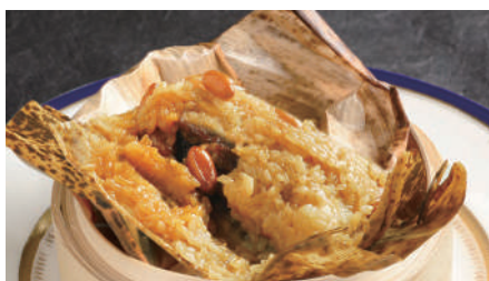
塩卵、椎茸、豚バラ肉入りちまき 700 Steamed Rice Dumpling Wrapped in Bamboo leaves with Pock and Mushroom 廣東粽子