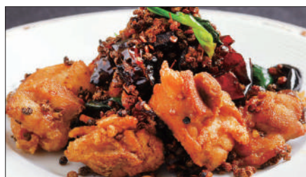
鶏肉の唐辛子山椒炒め Sauteed Chicken with Red Pepper and Pepper Tree 辣子鷄球