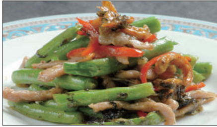
インゲン、干し海老のオリーブ漬け菜炒め Sauteed Kidney and Dried Shrimp with Pickled Olive leaf 欖菜蝦干四季豆