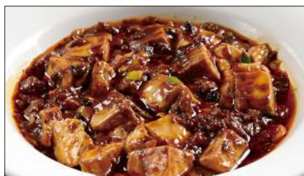
麻山椒*入りマーボー豆腐 Braised Tofu with Hot & Sichusn Pepper Sauce 聘珍麻辣豆腐