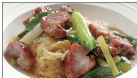
チャーシューとネギ、生姜のあんかけ焼きそば Sauteed Noodles with Barbecued Pork 姜葱叉焼炒麵