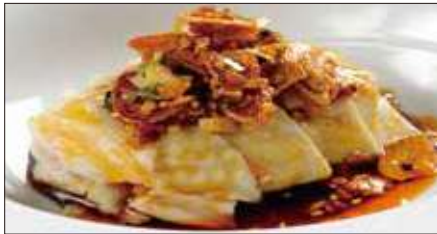
茹で国産鶏肉の唐辛子ニンニクソースがけ Boiled Chicken with Garlic and Hot Sauce 聘珍口水鶏