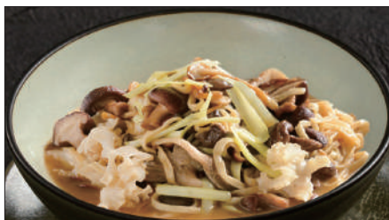
色々きのこの伊府麺、トリュフオイルの香り 1,200 Stewed Noodles with Various Mushroom, Truffle Oil 松露油什菇伊麵