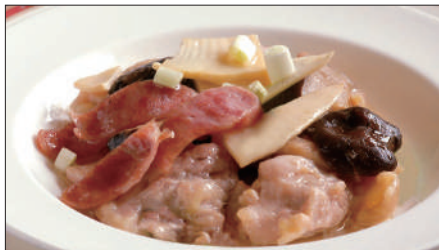
鶏肉と腸詰めの蒸し物 1,800 Steamed Chinese Sausage and Chicken 腊腸蒸鷄件