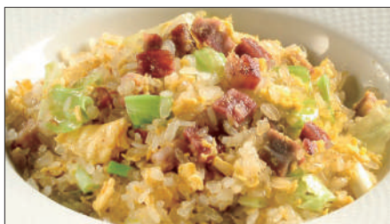
チャーシューとレタスのコンニャク米 ※ チャーハン 1,800 Stir-fried Small Konjak boll with Roasted Pork and Lettuce 叉焼炒蒟蒻米 ※ コンニャク米・・・お米の代用品で、コンニャクを米粒大にした加工品。コンニャクは不溶性食物繊維が豊富で、腸内の濁物を体外へ排出させる作用に優れています。