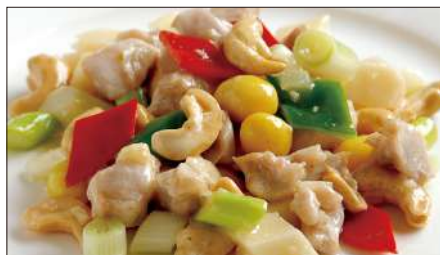
鶏肉とカシューナッツの炒め Sauteed Chicken and Cashew nut 腰果鶏丁

Tax Included 税込 表示価格にサービス料 10%を別途頂戴いたします