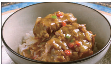
牛スネ肉のカレーあんかけご飯 1,000 Rice with Beef Curry 咖哩牛脛飯