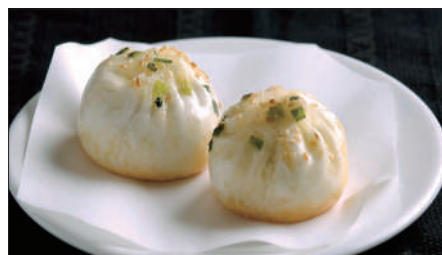
生煎包 (サンチンパオ) Pan-Fried Baozi Stuffed with Pork 生煎包