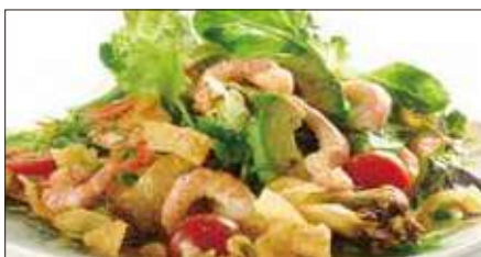
シェフサラダ (海老) Smoked Shrimp and Avocado and Mushrooms Salad 厨長蝦仁沙律