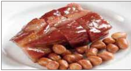
本格窯焼きチャーシュー Barbecued Pork 蜜汁叉焼

Tax Included 税込 表示価格にサービス料 10%を別途頂戴いたします