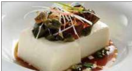
ピータン豆腐 Bean Curd and Preserved Duck's Egg with Soy Sauce 皮蛋拌豆腐

※滷水(ルーソイ): 醤油、八角、陳皮、甘草、月桂樹、草果(カルダモン)、中国冰糖、ネギ、生姜をベースに何年も継ぎ足し継ぎ足しを繰り返している当店自慢の滷水です。