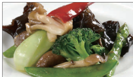
八種野菜のトリュフオイル炒め Sauteed Vegetables with Truffle Oil 松露油季節菜

Tax Included 税込 表示価格にサービス料 10%を別途頂戴いたします