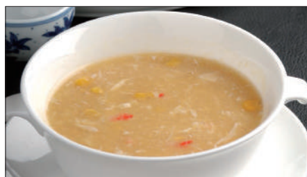
蟹肉入りコーンスープ Corn Soup with Crab Meat 蟹肉粟米湯