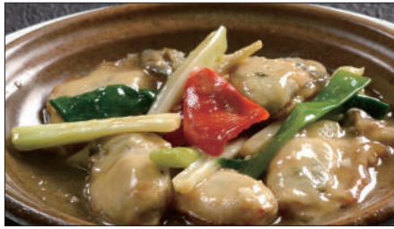
牡蠣のネギ、生姜炒め 1,400 Sauteed Oyster with Green Onion and Ginger 姜葱炒蠔仔

Tax Included 税込 表示価格にサービス料 10%を別途頂戴いたします