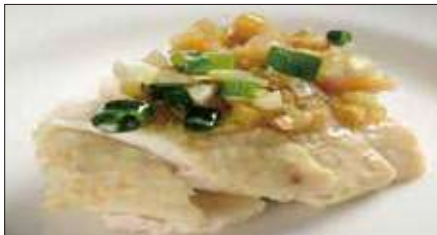
茹で国産鶏肉 ネギ・生姜ソース Boiled Chicken with Scallion and Ginger Sauce 白切肥鶏