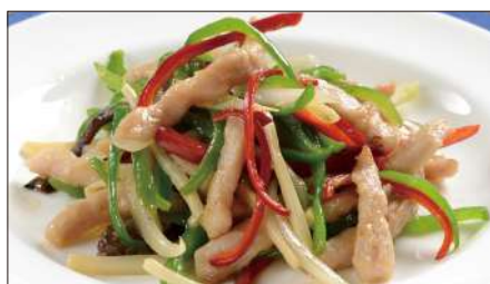
チンジャオロース (豚肉) Sauteed Pork with Sweet Pepper 青椒肉絲