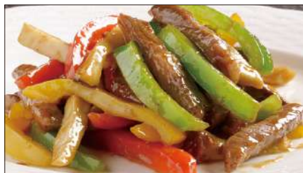
国産牛のチンジャオニューロース Sauteed Japanese Beef with Paprika 彩椒牛肉条