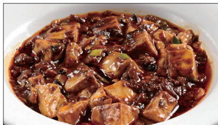
麻山椒 ※ 入りマーボー豆腐 1,473 Braised Tofu with Hot & Sichuan Pepper Sauce 聘珍麻辣豆腐