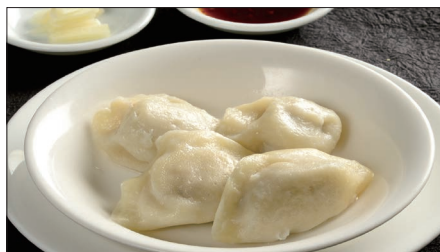
水ぎょうぎ、生ニンニク添え 491 Boiled Jiaozi Stuffed with Pork and Vegetables 水餃子