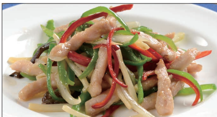
チンジャオロース (豚肉) Sauteed Pork with Sweet Pepper 青椒肉絲