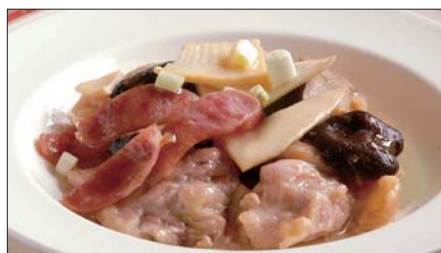
鶏肉と腸詰めの蒸し物 Steamed Chinese Sausage and Chicken 腊腸蒸鶏件