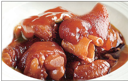
豚足、生姜の黒酢煮込み Stewed Pig Feet with Black Vinegar 浙醋姜猪爪