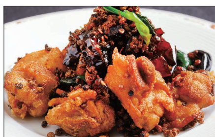
鶏肉の唐辛子山椒炒め Sauteed Chicken with Red Pepper and Pepper Tree 辣子鷄球