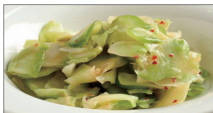
浅漬けザーサイ Pickled Sichuan Vegetables 鮮榨菜