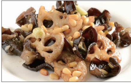
黒キクラゲ、蓮根、松の実の炒め Sauteed Judas's-ear and Lotus and pine nut 木耳炒蓮藕

Tax Included 税込 表示価格にサービス料 10%を別途頂戴いたします