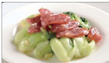
おすすめ野菜と腸詰めの炒め Sauteed Chinese Sausage and Vegetable 腊腸炒時蔬