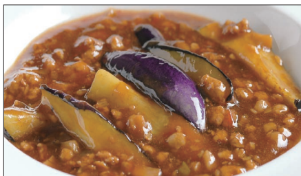
豚挽き肉と茄子の麻婆醬煮込み Stewed Eggplant with Pork Mincemeat and Hot Sauce 香辣肉崧茄瓜