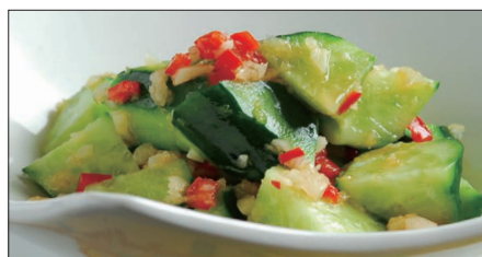
胡瓜の麻辣ニンニクソース和え Sliced Cucumber with Garlic and Hot Sauce 麻辣拌青瓜

燻製帆立貝、ミックスベビーリーフ、ミニレタス、スプラウト、アボカド、ミニトマト、エリンギ、舞茸、パプリカ、フライドガーリック、揚げワンタン皮、ミックスナッツ (カボチャの種、アーモンドスライス、松の実)