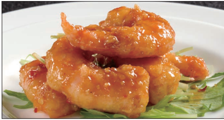
マラー 海老の麻辣ソース Sauteed Peeled Shrimp with Hot Sauce 麻辣蝦仁