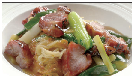
チャーシューとネギ、生姜のあんかけ焼きそば 1,473 Sautéed Noodles with Barbecued Pork 姜葱叉焼炒麵