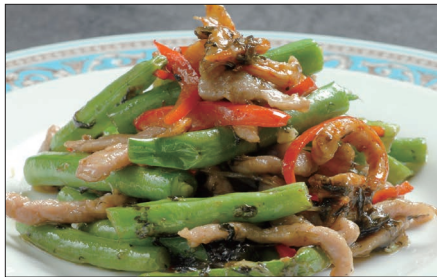
インゲン、干し海老のオリーブ漬け菜炒め Sauteed Kidney and Dried Shrimp 欖菜蝦干四季豆 with Pickled Olive leaf