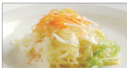
白菜の酢漬け Chinese Cabbage with Sour and Hot Sauce 酸辣白菜