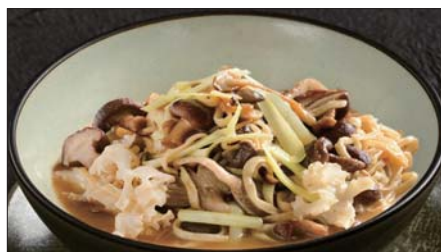
色々きのこの伊府麺、トリュフオイルの香り Stewed Noodles with Various Mushroom, Truffle Oil 松露油什菇伊麵