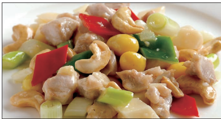
鶏肉とカシューナッツの炒め Sauteed Chicken and Cashew nut 腰果鶏丁