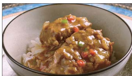
牛スネ肉のカレーあんかけご飯 Rice with Beef Curry 咖哩牛脛飯