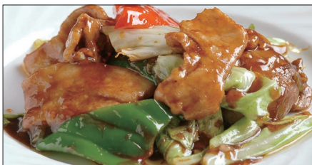
ホイコーロウ Sauteed Vegetables with Pork 回鍋肉