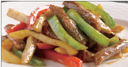
国産牛のチンジャオニューロース Sauteed Japanese Beef with Paprika 彩椒牛肉条