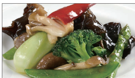
八種野菜のトリュフオイル炒め 982 Sautéed Vegetables with Truffle Oil 松露油季節菜

麻山椒は花椒(ホアジャオ)と呼ばれる四川省産の青山椒のことで、爽やかで鼻にぬける強い香りが特徴です。