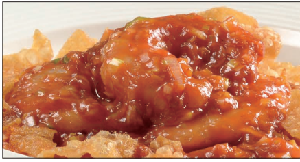
海老のチリソース Sauteed Peeled Shrimp with Chili Sauce 干焼蝦仁

Tax Included 税込 表示価格にサービス料 10%を別途頂戴いたします