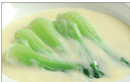
青梗菜のクリームソース Sauteed Chinese Vegetable with Cream Sauce 奶油菜胆