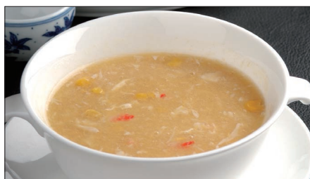
蟹肉入りコーンスープ 1,473 Corn Soup with Crab Meat 蟹肉粟米湯