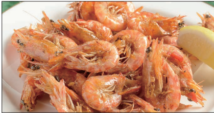
久米島産巻き海老のスパイス揚げ Fried Shrimp with Spice Salt 椒塩炸小蝦