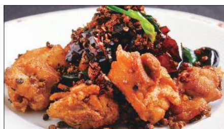
鶏肉の唐辛子山椒炒め Sauteed Chicken with Red Pepper and Pepper Tree 辣子鷄球