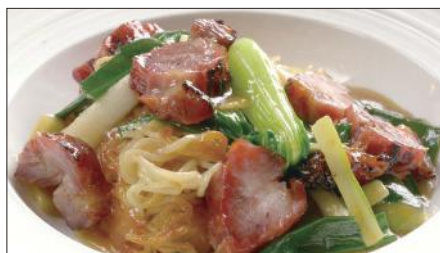
チャーシューとネギ、生姜のあんかけ焼きそば 1,473 Sauteed Noodles with Barbecued Pork 姜葱叉焼炒麵