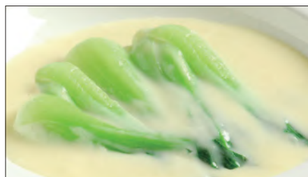
青梗菜のクリームソース Sauteed Chinese Vegetable with Cream Sauce 奶油菜胆