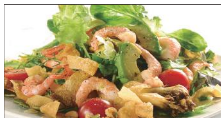
シェフサラダ (海老) Smoked Shrimp and Avocado and Mushrooms Salad 厨長蝦仁沙律