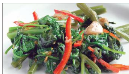
マーライジャン 空心菜の馬拉醬炒め Sauteed Vegetable with Malay Sauce 馬拉炒通菜