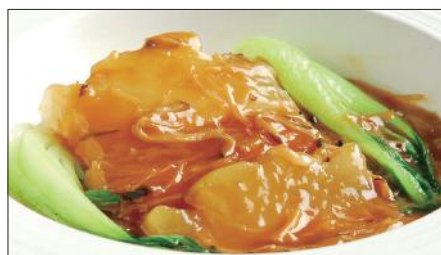
冬瓜の干し貝柱あんかけ Stewed Winter melon with Dried Scallop 干貝扒冬瓜