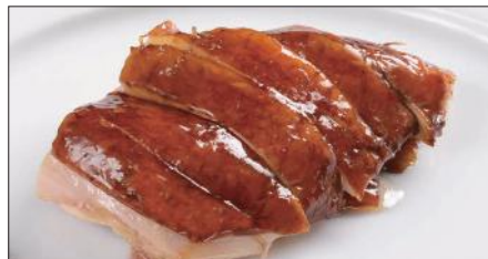
国産鶏肉の ルーソイ※ 滷水煮込み Boiled Chicken in Homemade Sauce 玫瑰油鶏