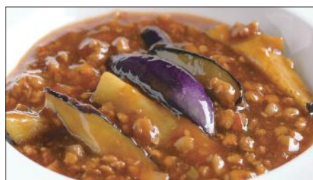
豚挽き肉と茄子の麻婆醬煮込み Stewed Eggplant with Pork Mincemeat and Hot Sauce 香辣肉崧茄瓜