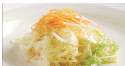
白菜の酢漬け Chinese Cabbage with Sour and Hot Sauce 酸辣白菜