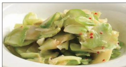
浅漬けザーサイ Pickled Sichuan Vegetables 鮮榨菜