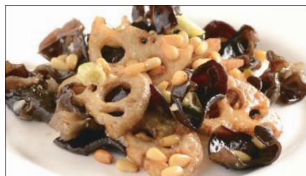
黒キクラゲ、蓮根、松の実の炒め Sauteed Judas's-ear and Lotus and pine nut 木耳炒蓮藕