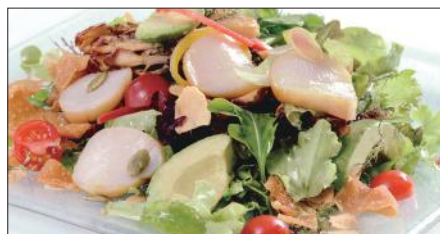
シェフサラダ (帆立貝) Smoked Scallop and Avocado and Mushrooms Salad 厨長扇貝沙律

燻製海老、ミックスベビーリーフ、ミニレタス、スプラウト、アボカド、ミニトマト、エリンギ、舞茸、パプリカ、フライドガーリック、揚げワンタン皮、ミックスナッツ (カボチャの種、アーモンドスライス、松の実)