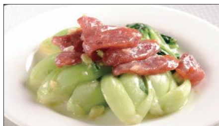
おすすめ野菜と腸詰めの炒め Sauteed Chinese Sausage and Vegetable 腊腸炒時蔬