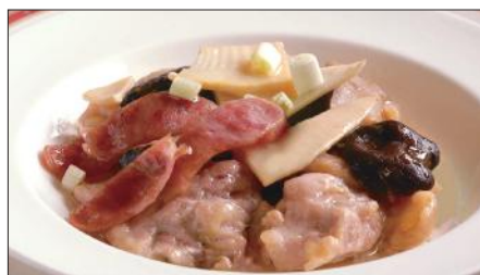
鶏肉と腸詰めの蒸し物 Steamed Chinese Sausage and Chicken 腊腸蒸鶏件