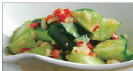
胡瓜の麻辣ニンニクソース和え Sliced Cucumber with Garlic and Hot Sauce 麻辣拌青瓜

燻製帆立貝、ミックスベビーリーフ、ミニレタス、スプラウト、アボカド、ミニトマト、エリンギ、舞茸、パプリカ、フライドガーリック、揚げワンタン皮、ミックスナッツ (カボチャの種、アーモンドスライス、松の実)