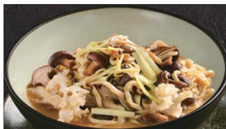
色々きのこの伊府麺、トリュフオイルの香り Stewed Noodles with Various Mushroom, Truffle Oil 松露油什菇伊麵