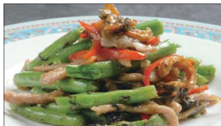
インゲン、干し海老のオリーブ漬け菜炒め Sauteed Kidney and Dried Shrimp 欖菜蝦干四季豆 with Pickled Olive leaf