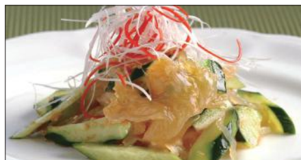
クラゲの頭と胡瓜の和え物 Sliced Jelly Fish and Cucumber with Sauce 青瓜海蜇頭

※滷水(ルーソイ): 醤油、八角、陳皮、甘草、月桂樹、草果(カルダモン)、中国冰糖、ネギ、生姜をベースに何年も継ぎ足し継ぎ足しを繰り返している当店自慢の滷水です。