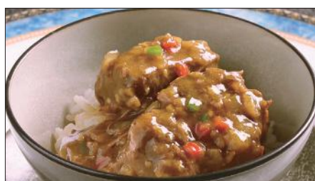
牛スネ肉のカレーあんかけご飯 Rice with Beef Curry 咖哩牛脛飯