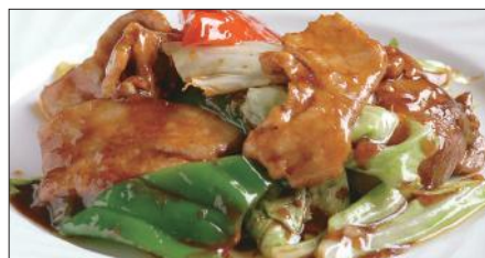
ホイコーロウ Sauteed Vegetables with Pork 回鍋肉