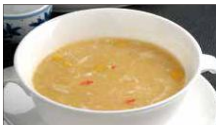
蟹肉入りコーンスープ 1,473 Corn Soup with Crab Meat 蟹肉粟米湯