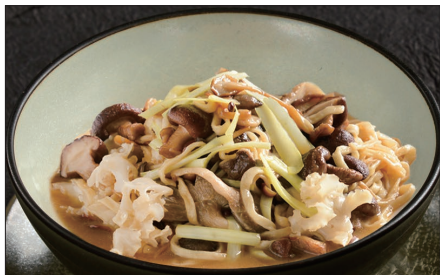
色々きのこの伊府麺、トリュフオイルの香り Stewed Noodles with Various Mushroom, Truffle Oil 松露油什菇伊麵