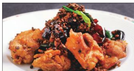
鶏肉の唐辛子山椒炒め Sauteed Chicken with Red Pepper and Pepper Tree 辣子鶏球