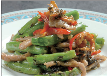
インゲン、干し海老のオリーブ漬け菜炒め Sauteed Kidney and Dried Shrimp 欖菜蝦干四季豆 with Pickled Olive leaf