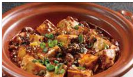
四川マーボー豆腐の土鍋煮込み 1,473 Braised Tofu with Hot & Spicy Sauce 麻婆豆腐