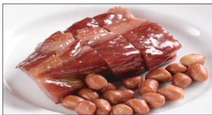
本格窯焼きチャーシュー Barbecued Pork 蜜汁叉焼