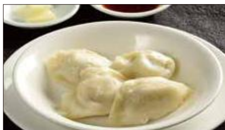
水ぎょうざ、生ニンニク添え 491 Boiled Jiaozi Stuffed with Pork and Vegetables 水餃子