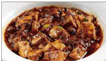
麻山椒 ※ 入りマーボー豆腐 1,473 Braised Tofu with Hot & Sichuan Pepper Sauce 聘珍麻辣豆腐