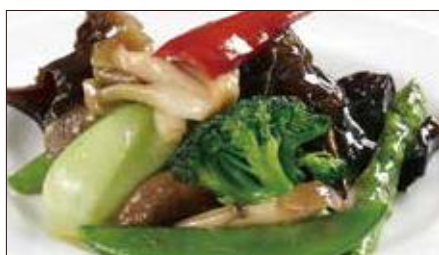
八種野菜のトリュフオイル炒め 982 Sauteed Vegetables with Truffle Oil 松露油季節菜

麻山椒は花椒(ホアジャオ)と呼ばれる四川省産の青山椒のことで、爽やかで鼻にぬける強い香りが特徴です。