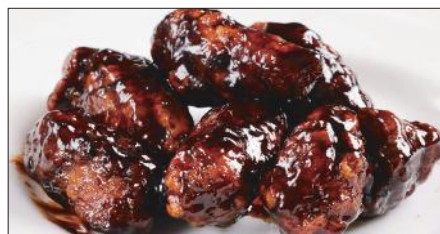
黒酢のすぶた Fried Pork with Chinese Vinegar Sauce 黒醋古老肉