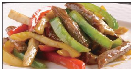
国産牛のチンジャオニューロース Sauteed Japanese Beef with Paprika 彩椒牛肉条