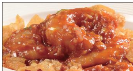
海老のチリソース Sauteed Peeled Shrimp with Chili Sauce 干焼蝦仁