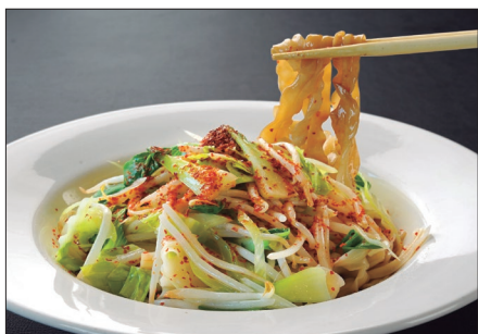
マーラー 麻辣和え麺 Noodles with Spicy Hot Sauce 麻辣寬条麵