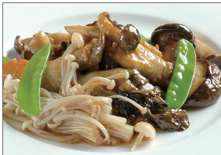
色々きのこのオイスターソース炒め Sauteed Mushrooms with Oyster Sauce 蠔油炒野菌