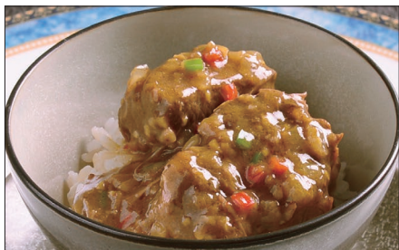
牛スネ肉のカレーあんかけご飯 Rice with Beef Curry 咖哩牛脛飯