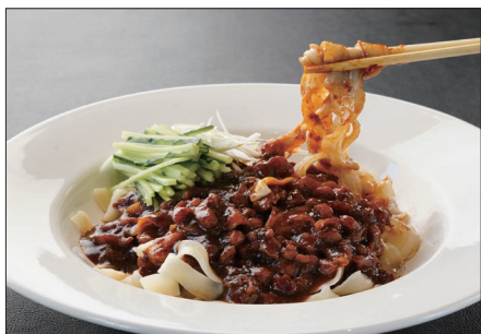
ジャージャー麺 Noodles with Soybean Paste 炸醬寬条麵