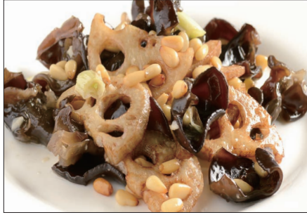
黒キクラゲ、蓮根、松の実の炒め Sauteed Judas's-ear and Lotus and pine nut 木耳炒蓮藕