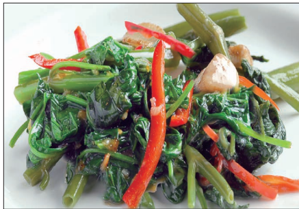
マーライジャン 空心菜の馬拉醬炒め Sauteed Vegetable with Malay Sauce 馬拉炒通菜