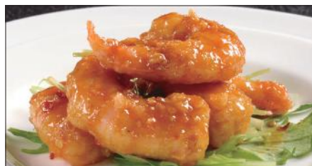
海老の マーラー 麻辣ソース Sauteed Peeled Shrimp with Hot Sauce 麻辣蝦仁