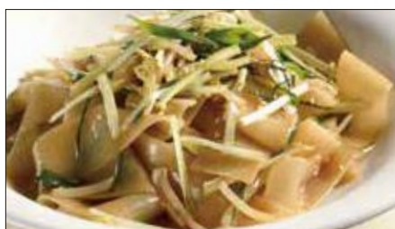
もやしと黄ニラの河粉 ※ (ホーフアン)炒め 1,178 Rice Noodles with Bean Sprouts and Yellow Chive 豆芽炒河粉