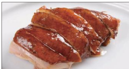
ルーツイ※ 国産鶏肉の滷水煮込み