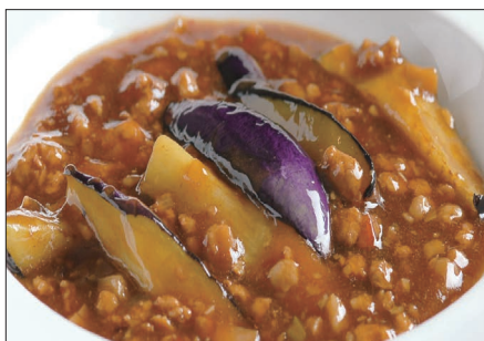
豚挽き肉と茄子の麻婆醬煮込み Stewed Eggplant with Pork Mincemeat and Hot Sauce 香辣肉崧茄瓜