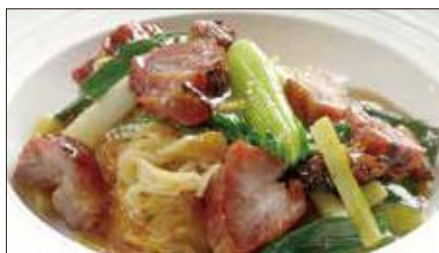
チャーシューとネギ、生姜のあんかけ焼きそば 1,473 Sauteed Noodles with Barbecued Pork 姜葱叉焼炒麵