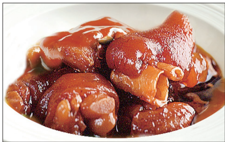
豚足、生姜の黒酢煮込み Stewed Pork Trotter with Black Vinegar 浙醋姜猪爪