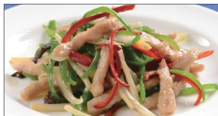
チンジャオロース (豚肉) Sauteed Pork with Sweet Pepper 青椒肉絲