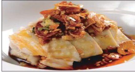
茹で国産鶏肉の唐辛子ニンニクソースかけ Boiled Chicken with Garlic and Hot Sauce 聘珍口水鶏