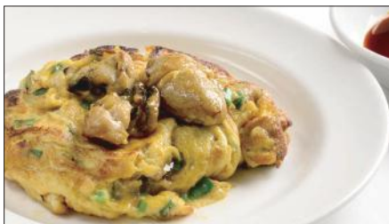
牡蠣とニラ、玉子の香り焼き Pan-fried Oyster and Chinese Chives and Egg 蠔仔韭菜煎蛋