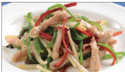
チンジャオロース (豚肉) Sauteed Pork with Sweet Pepper 青椒肉絲