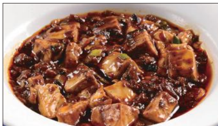
麻山椒*入りマーボー豆腐 Braised Tofu with Hot & Sichuan Pepper Sauce 聘珍麻辣豆腐