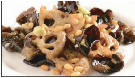
黒キクラゲ、蓮根、松の実の炒め Sauteed Judas's-ear and Lotus and pine nut 木耳炒蓮藕

Tax Included 税込 表示価格にサービス料 10%を別途頂戴いたします