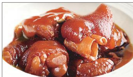
豚足、生姜の黒酢煮込み Stewed Pork Trotter with Black Vinegar 浙醋姜猪爪