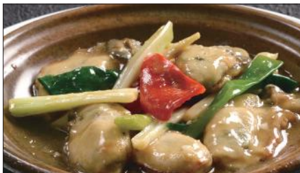
牡蠣のネギ、生姜炒め Sauteed Oyster with Green Onion and Ginger 姜葱炒蠔仔