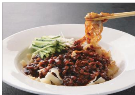
ジャージャー麺 Noodles with Soybean Paste 炸醬寬条麵