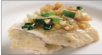
茹で国産鶏肉 ネギ・生姜ソース Boiled Chicken with Scallion and Ginger Sauce 白切肥鶏