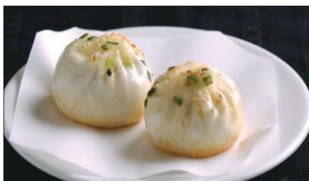
生煎包 (サンチンパオ) Pan-Fried Baozi Stuffed with Pork 生煎包