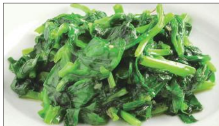
豆苗の塩味炒め Sauteed Bean Seedling 清炒豆苗

Tax Included 税込 表示価格にサービス料 10%を別途頂戴いたします