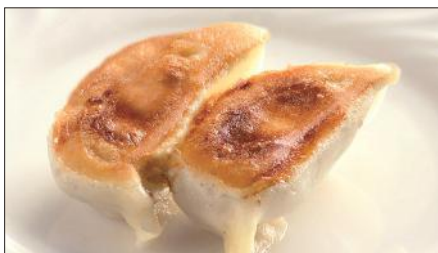
聘珍樓焼きぎょうざ Pan-Fried Jiaozi Stuffed with Pork and Vegetables 鍋貼餃