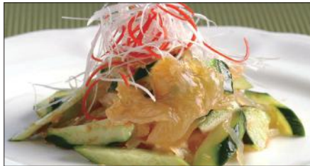
クラゲの頭と胡瓜の和え物 Sliced Jelly Fish and Cucumber with Sauce 青瓜海蜇頭