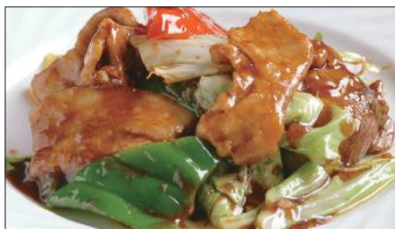
ホイコーロウ Sauteed Vegetables with Pork 回鍋肉