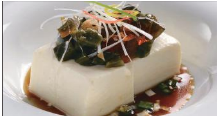
ピータン豆腐 Bean Curd and Preserved Duck's Egg with Soy Sauce 皮蛋拌豆腐

※ ルーソイ 煮込み(ルーソイ): 醤油、八角、陳皮、甘草、月桂樹、草果(カルダモン)、中国冰糖、ネギ、生姜をベースに何年も継ぎ足し継ぎ足しを繰り返している当店自慢の ルーソイ 煮込みです。