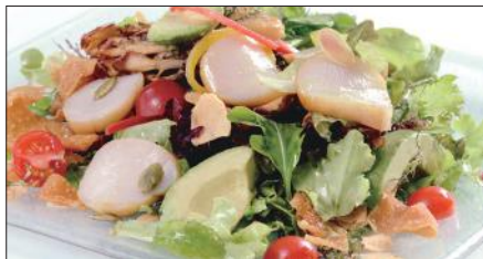
シェフサラダ (帆立貝) Smoked Scallop and Avocado and Mushrooms Salad 厨長扇貝沙律

燻製海老、ミックスベビーリーフ、ミニレタス、スプラウト、アボカド、ミニトマト、エリンギ、舞茸、パプリカ、フライドガーリック、揚げワントン皮、ミックスナッツ (カボチャの種、アーモンドスライス、松の実)