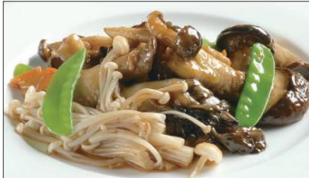
色々きのこのオイスターソース炒め Sauteed Mushrooms with Oyster Sauce 蠔油炒野菌