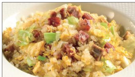
チャーシューとレタスのコンニャク米 ※ チャーハン 1,800 Stir-fried Small Konjak boll with Roasted Pork and Lettuce 叉焼炒蒟蒻米 ※コンニャク米…お米の代用品で、コンニャクを米粒大にした加工品。コンニャクは不溶性食物繊維が豊富で、腸内の濁物を体外へ排出させる作用に優れています。