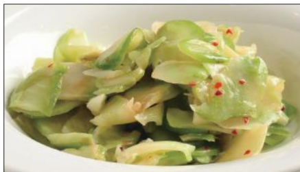
浅漬けザーサイ Pickled Sichuan Vegetables 鮮榨菜