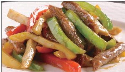
国産牛のチンジャオニューロース Sauteed Japanese Beef with Paprika 彩椒牛肉条