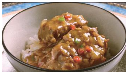
牛スネ肉のカレーあんかけご飯 Rice with Beef Curry 咖哩牛脛飯