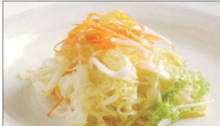
白菜の酢漬け Chinese Cabbage with Sour and Hot Sauce 酸辣白菜