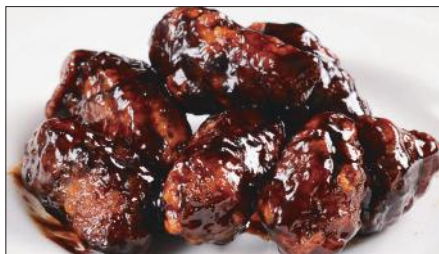
黒酢のすぶた Fried Pork with Chinese Vinegar Sauce 黒醋古老肉