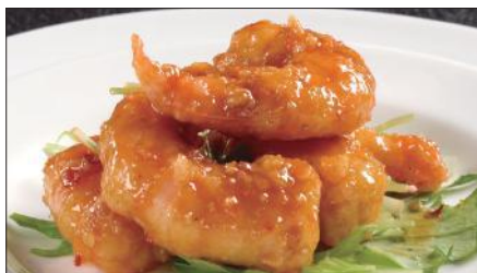
海老の麻辣ソース Sauteed Peeled Shrimp with Hot Sauce 麻辣蝦仁