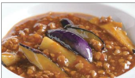
豚挽き肉と茄子の麻婆醬煮込み Stewed Eggplant with Ground Pork and Hot Sauce 香辣肉崧茄瓜