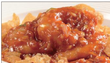
海老のチリソース Sauteed Peeled Shrimp with Chili Sauce 干焼蝦仁