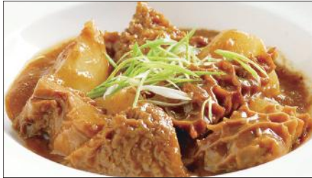
牛ハチノスと大根の沙茶醬煮込み Stewed Beef Tripe and Japanese White Radish 沙茶蘿白牛肚 with Shacha Sauce