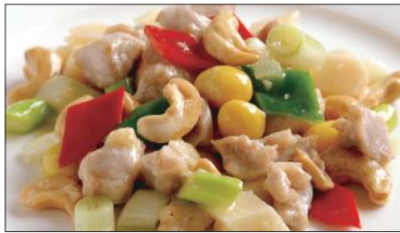
鶏肉とカシューナッツの炒め Sauteed Chicken and Cashew nut 腰果鶏丁

Tax Included 税込 表示価格にサービス料 10%を別途頂戴いたします