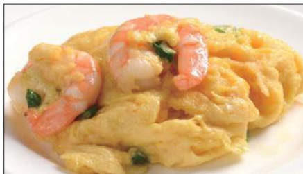
海老と玉子の炒め Sauteed Peeled Shrimp and Egg 滑蛋蝦仁