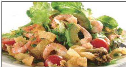
シェフサラダ (海老) Smoked Shrimp and Avocado and Mushrooms Salad 厨長蝦仁沙律