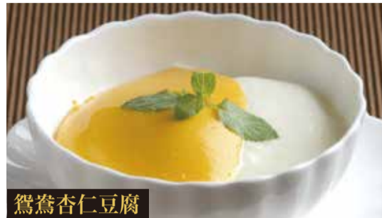
マンゴー杏仁豆腐

豆乳でコクをプラスした当店オリジナル豆乳杏仁豆腐。ヘルシーで女性の方にも人気です。