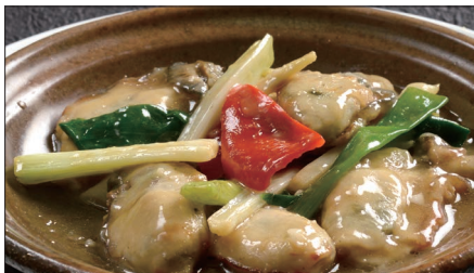
牡蠣のネギ、生姜炒め Sauteed Oyster with Green Onion and Ginger 姜葱炒蠔仔