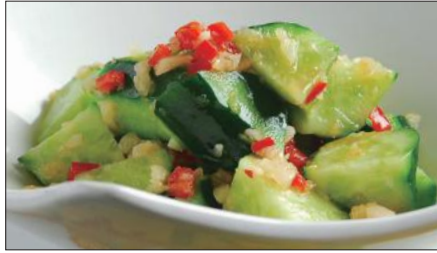
胡瓜の麻辣ニンニクソース和え Sliced Cucumber with Garlic and Hot Sauce 麻辣拌青瓜 900

Tax Included 税込 表示価格にサービス料 10%を別途頂戴いたします