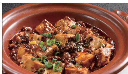
四川マーボー豆腐の土鍋煮込み Braised Tofu with Hot & Spicy Sauce 麻婆豆腐