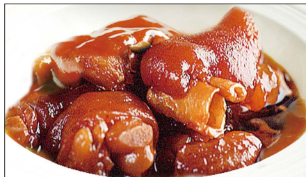
豚足、生姜の黒酢煮込み 1,800 Stewed Pork Trotter with Black Vinegar 浙醋姜猪爪

Tax Included 税込 表示価格にサービス料 10%を別途頂戴いたします