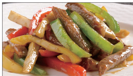
国産牛のチンジャオニューロース Sauteed Japanese Beef with Paprika 彩椒牛肉条