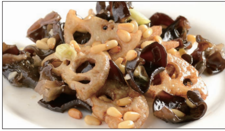
黒キクラゲ、蓮根、松の実の炒め Sauteed Judas's-ear and Lotus and pine nut 木耳炒蓮藕

Tax Included 税込 表示価格にサービス料 10%を別途頂戴いたします