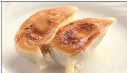
聘珍樓焼きぎょうざ Pan-Fried Jiaozi Stuffed with Pork and Vegetables 鍋貼餃