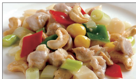
鶏肉とカシューナッツの炒め Sauteed Chicken and Cashew nut 腰果鶏丁