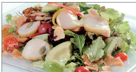
シェフサラダ (帆立貝) Smoked Scallop and Avocado and Mushrooms Salad 厨長扇貝沙律

燻製海老、ミックスベビーリーフ、ミニレタス、スプラウト、アボカド、ミニトマト、エリンギ、舞茸、パプリカ、フライドガーリック、揚げワントン皮、ミックスナッツ (カボチャの種、アーモンドスライス、松の実)