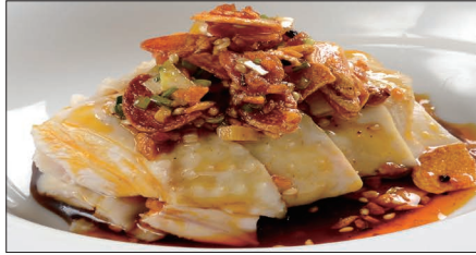
茹で国産鶏肉の唐辛子ニンニクソースかけ Boiled Chicken with Garlic and Hot Sauce 聘珍口水鶏