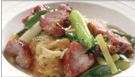
チャーシューとネギ、生姜のあんかけ焼きそば Sauteed Noodles with Barbecued Pork 姜葱叉焼炒麵