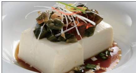
ピータン豆腐 Bean Curd and Preserved Duck's Egg with Soy Sauce 皮蛋拌豆腐

※ ルーソイ 煮込み(ルーソイ): 醤油、八角、陳皮、甘草、月桂樹、草果(カルダモン)、中国冰糖、ネギ、生姜をベースに何年も継ぎ足し継ぎ足しを繰り返している当店自慢の ルーソイ 煮込みです。