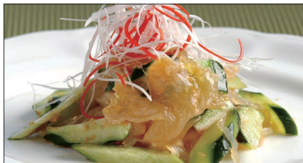
クラゲの頭と胡瓜の和え物 Sliced Jelly Fish and Cucumber with Sauce 青瓜海蜇頭