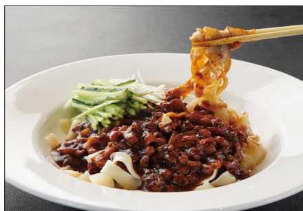
ジャージャー麺 1,600 Noodles with Soybean Paste 炸醬寬条麵