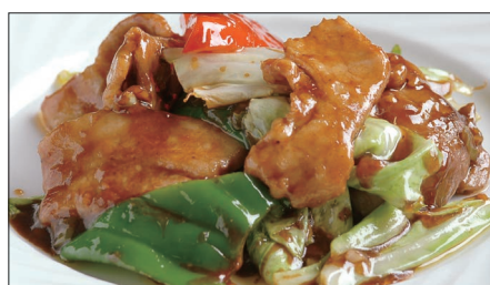
ホイコーロウ Sauteed Vegetables with Pork 回鍋肉