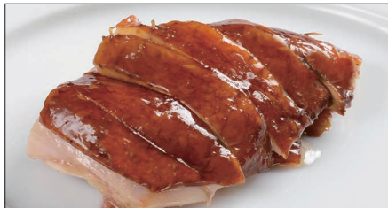
国産鶏肉の ルーソイ ※ 煮込み Boiled Chicken in Homemade Sauce 玫瑰油鶏