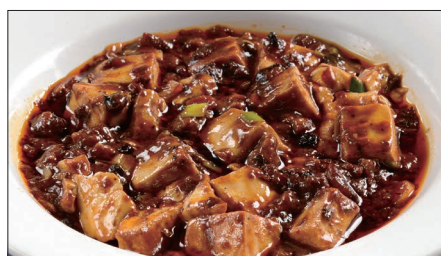
麻山椒*入りマーボー豆腐 Braised Tofu with Hot & Sichusn Pepper Sauce 聘珍麻辣豆腐