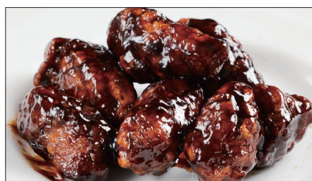
黒酢のすぶた Fried Pork with Chinese Vinegar Sauce 黒醋古老肉