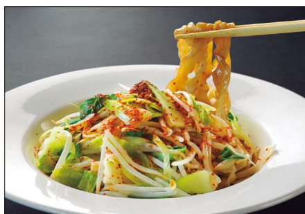
マーラー 1,600 Noodles with Spicy Hot Sauce 麻辣寬条麵

アレルギーをお持ちのお客様は事前にスタッフまでご相談ください。季節と市場入荷により盛り付けの内容は写真と異なる場合がございます。