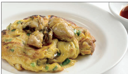
牡蠣とニラ、玉子の香り焼き Pan-fried Oyster and Chinese Chives and Egg 蠔仔韭菜煎蛋