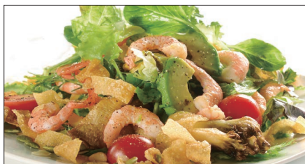
シェフサラダ (海老) Smoked Shrimp and Avocado and Mushrooms Salad 厨長蝦仁沙律