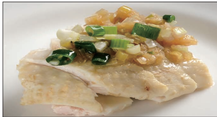
茹で国産鶏肉 ネギ・生姜ソース Boiled Chicken with Scallion and Ginger Sauce 白切肥鶏