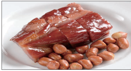
本格窯焼きチャーシュー Barbecued Pork 蜜汁叉焼

Tax Included 税込 表示価格にサービス料 10%を別途頂戴いたします