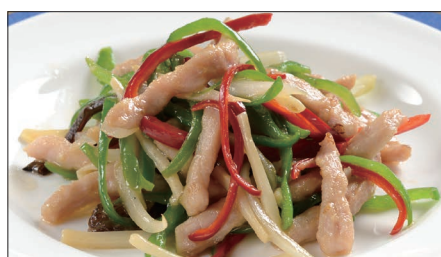
チンジャオロース (豚肉) Sauteed Pork with Sweet Pepper 青椒肉絲