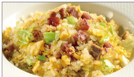
チャーシューとレタスのコンニャク米 ※ チャーハン 1,800 Stir-fried Small Konjak boll with Roasted Pork and Lettuce 叉焼炒蒟蒻米 ※コンニャク米…お米の代用品で、コンニャクを米粒大にした加工品。コンニャクは不溶性食物繊維が豊富で、腸内の濁物を体外へ排出させる作用に優れています。