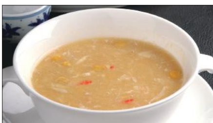
蟹肉入りコーンスープ Corn Soup with Crab Meat 蟹肉粟米湯