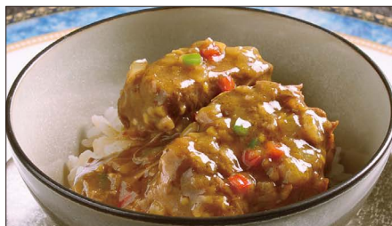
牛スネ肉のカレーあんかけご飯 1,000 Rice with Beef Curry 咖喱牛脛飯