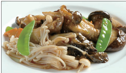
色々きのこのオイスターソース炒め Sauteed Mushrooms with Oyster Sauce 蠔油炒野菌