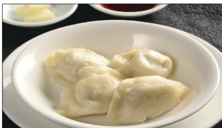
水ぎょうざ、生ニンニク添え Boiled Jiaozi Stuffed with Pork and Vegetables 水餃子