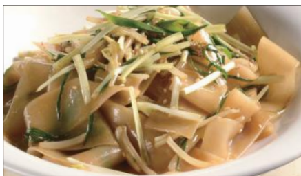
もやしと黄ニラの河粉 ※ (ホーフアン)炒め Rice Noodles with Bean Sprouts and Yellow Chive 豆芽炒河粉