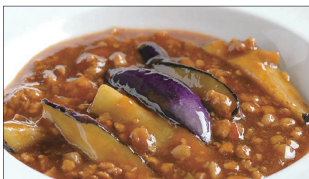
豚挽き肉と茄子の麻婆醬煮込み Stewed Eggplant with Ground Pork and Hot Sauce 香辣肉崧茄瓜