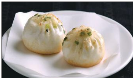
生煎包 (サンチンパオ) Pan-Fried Baozi Stuffed with Pork 生煎包