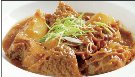
牛ハチノスと大根の沙茶醬煮込み Stewed Beef Tripe and Japanese White Radish 沙茶蘿白牛肚 with Shacha Sauce