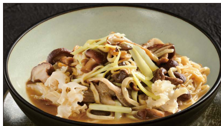
色々きのこの伊府麺、トリュフオイルの香り 1,200 Stewed Noodles with Various Mushroom, Truffle Oil 松露油什菇伊麵