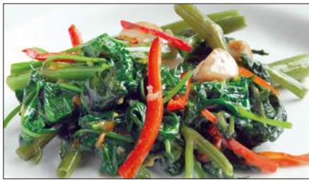
空心菜の馬拉醬炒め Stir Fried Water Spinach with Malay sauce 馬拉炒通菜