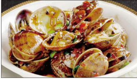
あさりと春雨の豆豉醬煮込み 1,669 Stewed Clams and Vermicelli with Black Bean Sauce 豆豉粉絲鮮蜆

Tax Included 税込 表示価格にサービス料 10%を別途頂戴いたします