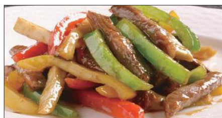
国産牛のチンジャオニューロース Sauteed Japanese Beef with Paprika 彩椒牛肉条