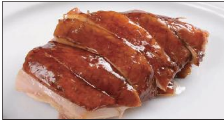
ルーツイ※ 国産鶏肉の滷水煮込み Boiled Chicken in Homemade Sauce 玫瑰油鶏