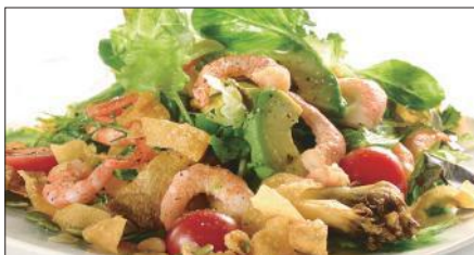
シェフサラダ (海老) Smoked Shrimp and Avocado and Mushrooms Salad 厨長蝦仁沙律