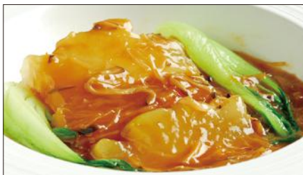
冬瓜の干し貝柱あんかけ Wax gourd with Dried scallop starchy sauce 干貝扒冬瓜