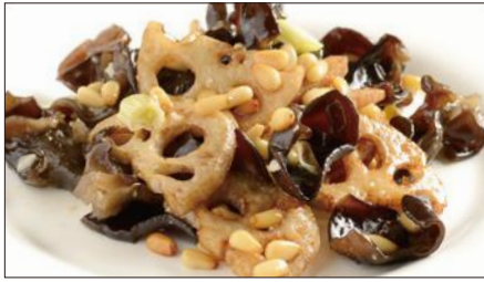
黒キクラゲ、蓮根、松の実の炒め Sauteed Judas's-ear and Lotus and pine nut 木耳炒蓮藕

Tax Included 税込 表示価格にサービス料 10%を別途頂戴いたします