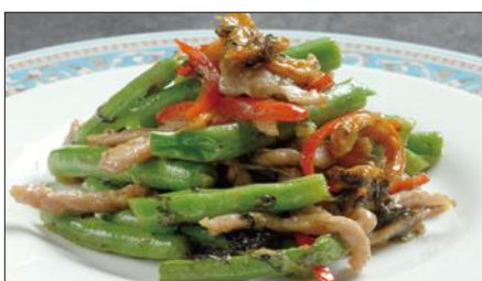
インゲン、干し海老のオリーブ漬け菜炒め Sauteed Kidney and Dried Shrimp with Pickled Olive leaf 欖菜蝦干四季豆