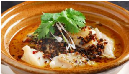
白身魚の水煮 (サイズウ)※ 2,946 Sichuan Boiled Fish 水煮魚