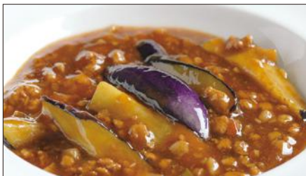
豚挽き肉と茄子の麻婆醬煮込み Stewed Eggplant with Ground Pork and Hot Sauce 香辣肉崧茄瓜