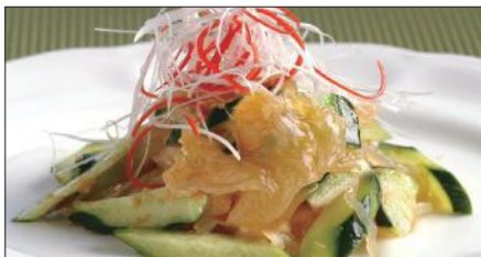
クラゲの頭と胡瓜の和え物 Sliced Jelly Fish and Cucumber with Sauce 青瓜海蜇頭

※滷水(ルーツイ): 醤油、八角、陳皮、甘草、月桂樹、草果(カルダモン)、中国冰糖、ネギ、生姜をベースに何年も継ぎ足し継ぎ足しを繰り返している当店自慢の滷水です。