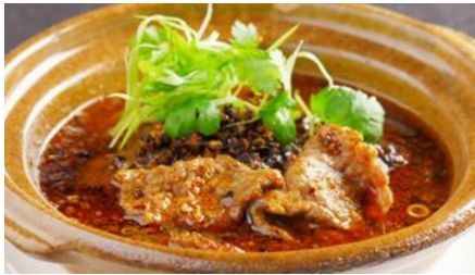
牛肉の水煮 (サイズウ)※ 1,964 Sichuan Boiled Beef 水煮牛肉