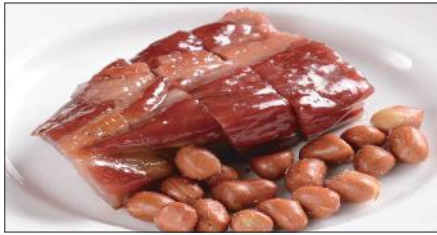
本格窯焼きチャーシュー Barbecued Pork 蜜汁叉焼