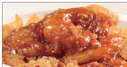
海老のチリソース Sauteed Peeled Shrimp with Chili Sauce 干焼蝦仁