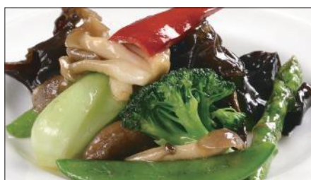
八種野菜のトリュフオイル炒め Sautéed Vegetables with Truffle Oil 松露油季節菜

麻山椒は花椒(ホアジャオ)と呼ばれる四川省産の青山椒のことで、爽やかで鼻にぬける強い香りが特徴です。