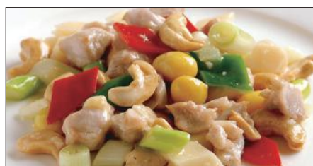
鶏肉とカシューナッツの炒め Sauteed Chicken and Cashew nut 腰果鶏丁