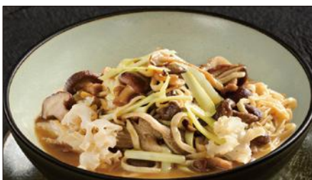
色々きのこの伊府麺、トリュフオイルの香り 1,178 Stewed Noodles with Various Mushroom, Truffle Oil 松露油什菇伊麵