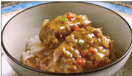
牛スネ肉のカレーあんかけご飯 982 Rice with Beef Curry 咖哩牛脛飯