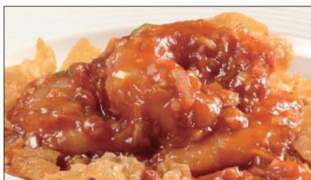
海老のチリソース Sauteed Peeled Shrimp with Chili Sauce 干焼蝦仁 1,900