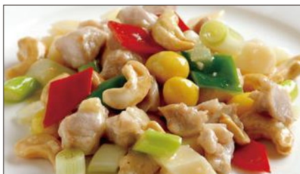
鶏肉とカシューナッツの炒め Sauteed Chicken and Cashew nut 腰果鶏丁