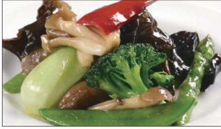
八種野菜のトリュフオイル炒め Sauteed Vegetables with Truffle Oil 松露油季節菜

Tax Included 税込 表示価格にサービス料 10%を別途頂戴いたします