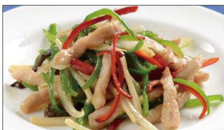
チンジャオロース (豚肉) Sauteed Pork with Sweet Pepper 青椒肉絲