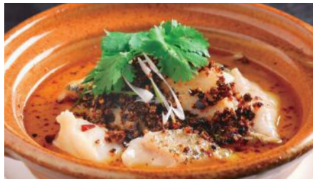
白身魚の水煮 (スイズウ)※ 3,000 Sichuan Boiled Fish 水煮魚