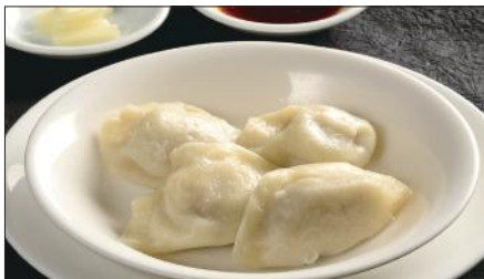
水ぎょうざ、生ニンニク添え Boiled Jiaozi Stuffed with Pork and Vegetables 水餃子