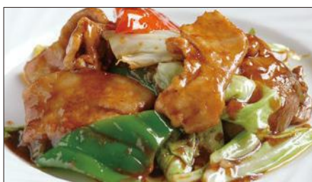
ホイコーロウ Sauteed Vegetables with Pork 回鍋肉