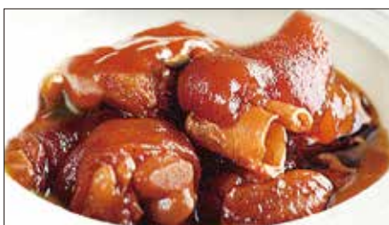
豚足、生姜の黒酢煮込み Stewed Pork Trotter with Black Vinegar 浙醋姜猪脚