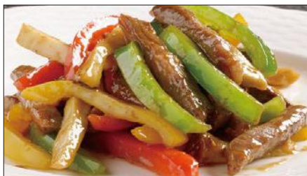
国産牛のチンジャオニューロース Sauteed Japanese Beef with Paprika 彩椒牛肉条