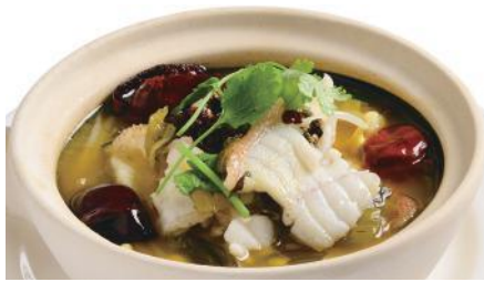
白身魚と漬け菜、唐辛子の煮込み 2,400 Boiled Fish with Pickled Vegetable and Chili 酸菜魚

Tax Included 税込 表示価格にサービス料 10%を別途頂戴いたします