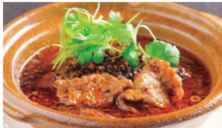
牛肉の水煮 (スイズウ)※ 2,000 Sichuan Boiled Beef 水煮牛肉