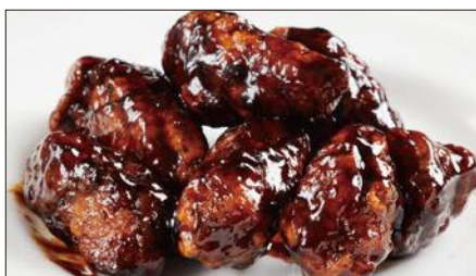
黒酢のすぶた Fried Pork with Chinese Vinegar Sauce 黒醋古老肉