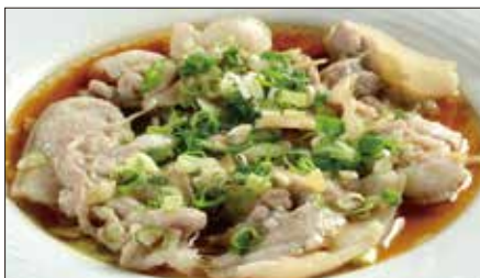
皮付き豚バラ肉の大澳特産蝦醬(ハージャン)蒸し Steamed Pork with HongKong Shrimp Paste Sauce 大澳蝦醬蒸腩肉