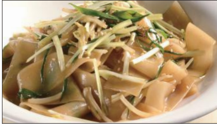
もやしと黄ニラの河粉 ※ (ホーフアン)炒め Rice Noodles with Bean Sprouts and Yellow Chive 豆芽炒河粉