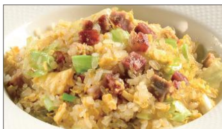
チャーシューとレタスのコンニャク米 ※ チャーハン 1,800 Stir-fried Small Konjak boll with Roasted Pork and Lettuce 叉焼炒蒟蒻米

※コンニャク米 お米の代用品で、コンニャクを米粒大にした加工品。コンニャクは不溶性食物繊維が豊富で、腸内の濁物を体外へ排出させる作用に優れています。