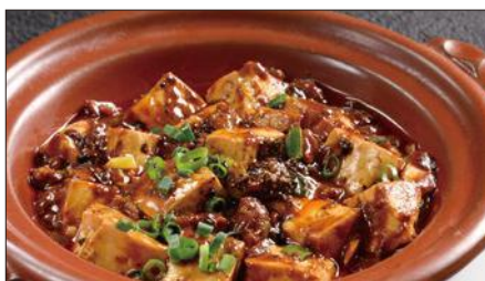
四川マーボー豆腐の土鍋煮込み Braised Tofu with Hot & Spicy Sauce 麻婆豆腐